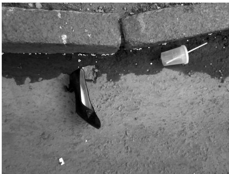
"Perfume de arrabal"